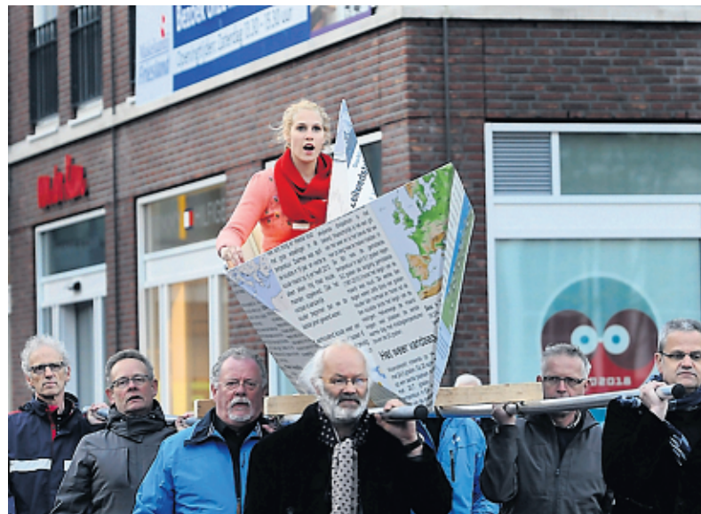
Scène uit De Iisfoarstin van Tryater.